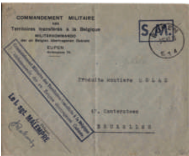
Photo 2 - Enveloppe expédiée par l'administration communale de Losheim (sous direction militaire) via le bureau de poste de Losheim (14 octobre 1950).

La Belgique y installait un régime militaire. Ce gouvernement militaire était dirigé par le général Paul Bolle.