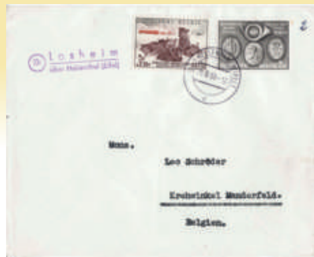
Photo 6 - Lettre affranchie avec des timbres-poste belges, avec une oblitération allemande après le transfert à l'Allemagne. L'oblitération est du bureau de Hellenthal (Eifel) avec une marque de Losheim. L'oblitération est datée du 2 août 1958 à 12 h, l'heure exacte du transfert par la Belgique. Il s'agit donc de la première levée effectuée par la poste allemande.