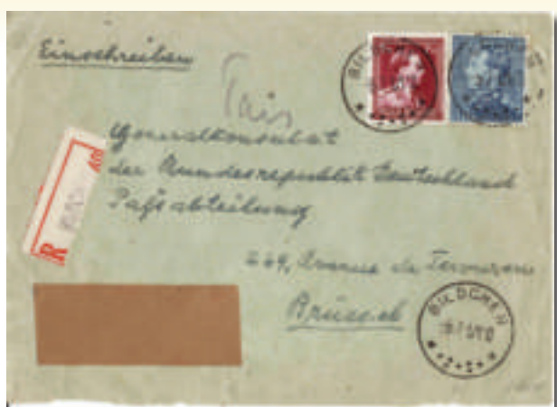
Photo 3 - Lettre recommandée expédiée depuis Bildchen (3 juillet 1951).

valable pour la justice. Bolle était le président d'un tribunal d'exception pour ce territoire. Aucune possibilité d'appel n'était prévue.