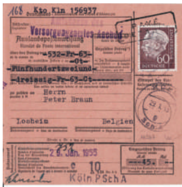
Photo 4 - Recto d'un mandat postal d'Allemagne vers Losheim (29 janvier 1955).

La frontière était rectifiée par le traité correctif de la